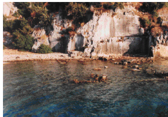
6 干潮の時にしかけた方がケコヴァの海中遺跡がよく見えるとガイドブックに書いてあったが、地元の人に聞くと「干潮」とは何か知らない様子。