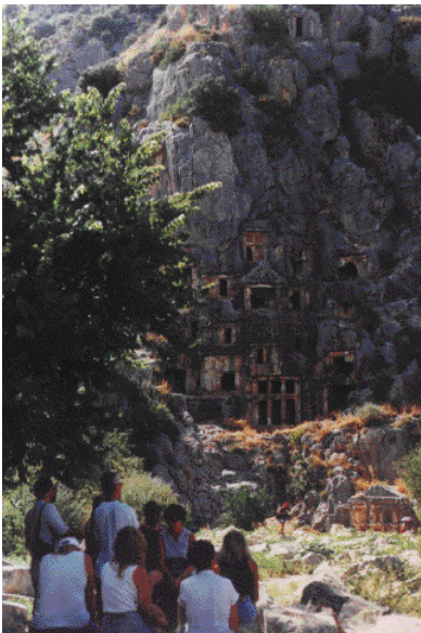
4 この辺り一帯に見られる岩壁遺跡