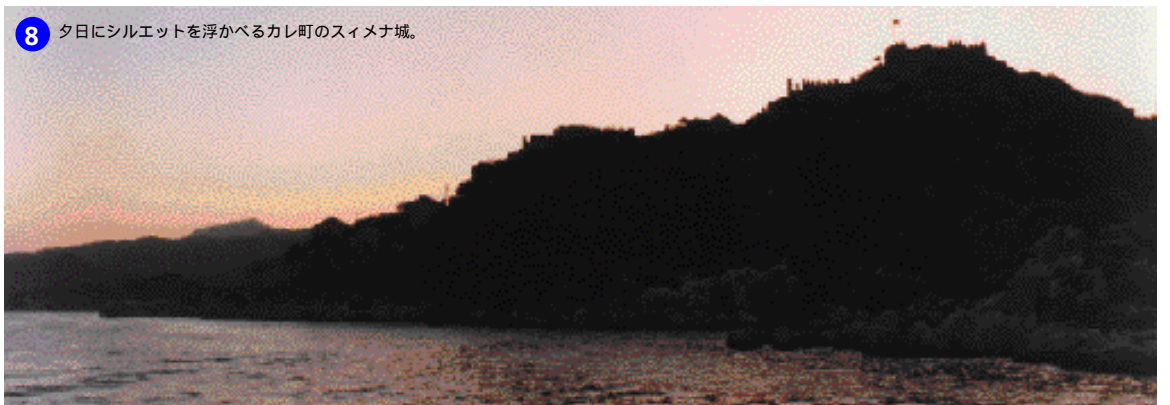
8 夕日にシルエットを浮かべるカレ町のスィメナ城。