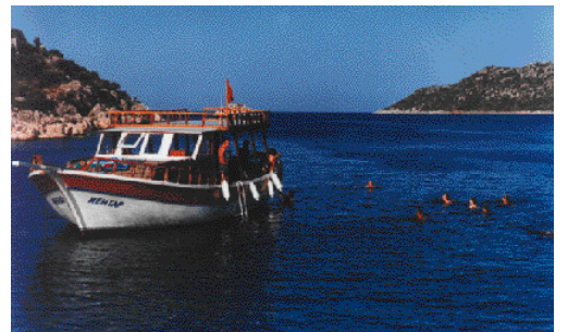
5 デムレから車で5分ほどの埠頭から船に乗り、一路ケコヴァへ。まさにクルージングの醍醐味。美しい湾に来ると、船から海へ飛び込む！足が届かないところで泳げない人でも、絶対泳いで見たくなる。