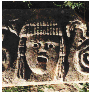
3 リアルな表情を浮かべたレリーフが至るところに転がっている。