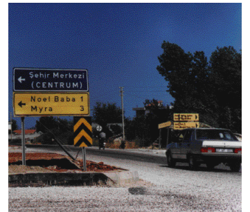
1 ノエル・ババとは「クリスマスのお父さん」、つまり、サンタクロースのことである。聖ニコラウス教会とミラの遺跡のあるデムレにはここから入る。