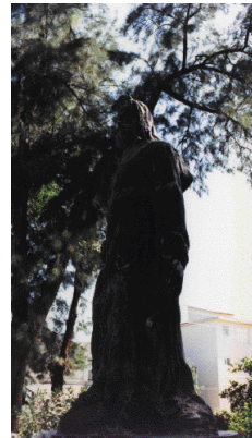
2 教会前に本当に立っている聖ニコラウスの像。